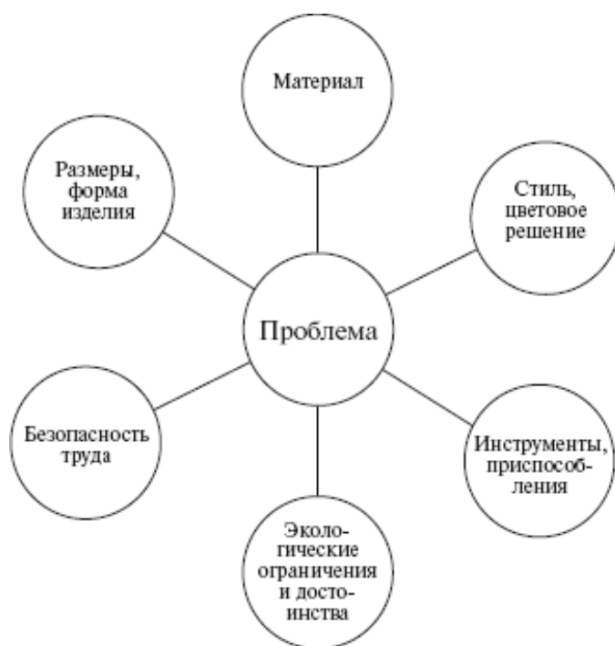
Рисунок 4 – «Звездочка обдумывания»

Внешне эта схема напоминает звезду с расходящимися во все стороны лучами. В центре обозначается название выбранной темы, а на лучах, исходящих от центра, записываются возможные решения вопросов, без которых невозможно изготовить данное изделие.