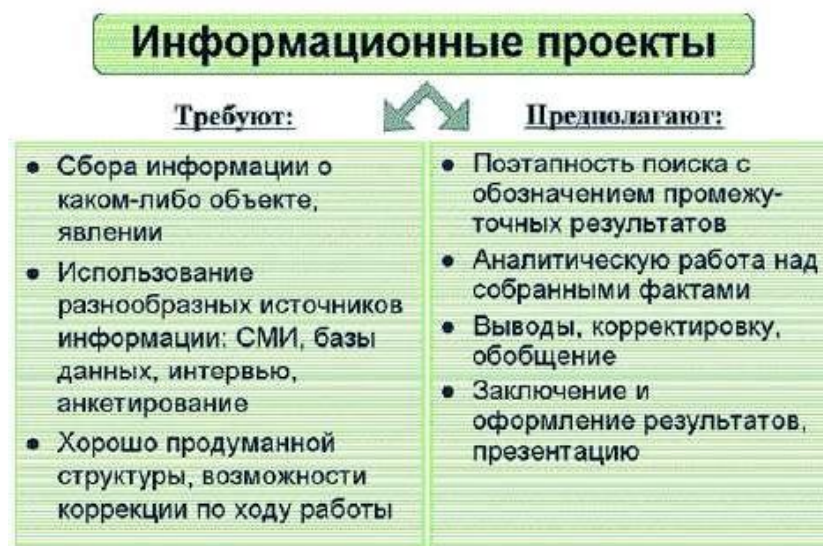
Рисунок 1 – Работа над информационным проектом

Работа над информационным проектом может исходить из обозначенного на рисунке 1 подхода.